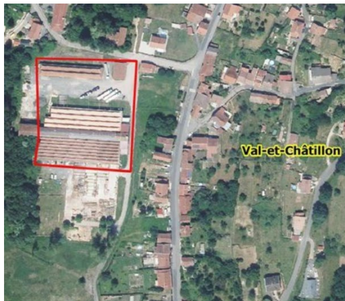
La zone photovoltaïque est basée sur les anciennes usines de textile. Une étude pourrait être menée pour analyser la possibilité d'installer des panneaux photovoltaïques en toiture.

Concernant le projet éolien, les études se poursuivent toujours, et vont s'étendre jusqu'à mi-2024. Elles ont débuté en février cette année, avec la mise en place du mât de mesure de vent au lieu-dit la Salle de Danse. A ce jour, les études naturalistes menées par le bureau d'étude Rainette sont toujours en cours, et les études de vent se poursuivent grâce au mât de mesure et ses anémomètres qui enregistrent les vitesses de vent en continu.