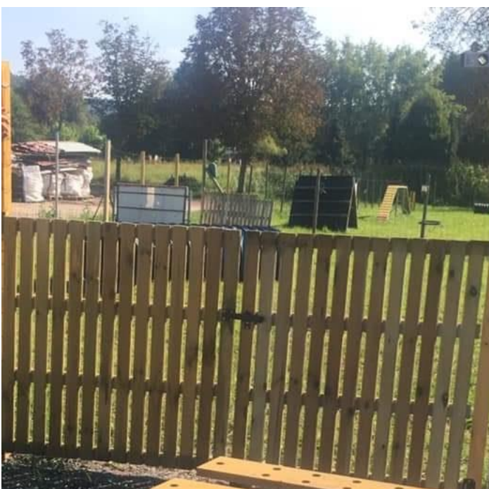
La pose de la porte