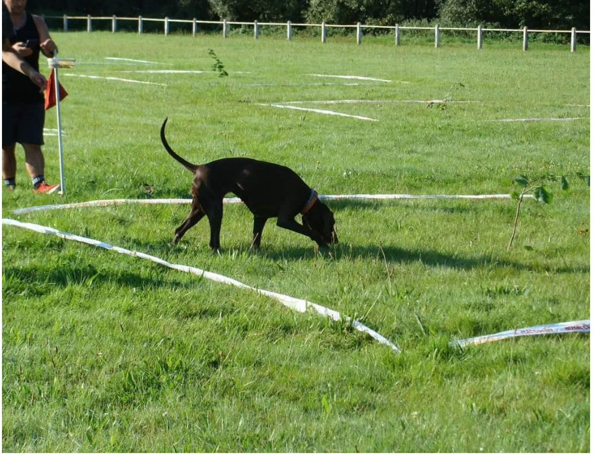
Chien sur carré au cavage