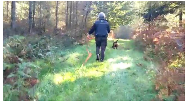
Sur la piste du disparu