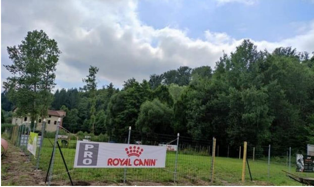
Notre terrain en cours de transformation

Avenue Veillon Zone Industrielle 54480 VAL-ET-CHATILLON clubcanin54480@gmail.com